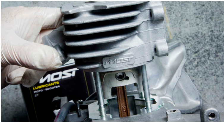
5. Poser le cylindre après lubrification.