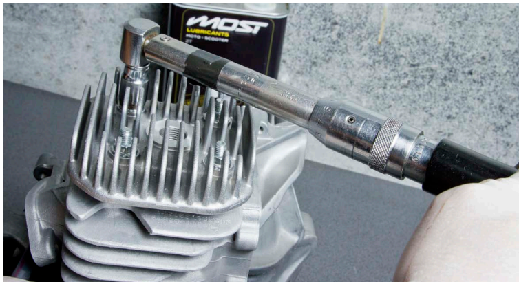
7. Après avoir monter la culasse dans le bon sens, la serrer avec une clef dynamométrique à 1,10 kg