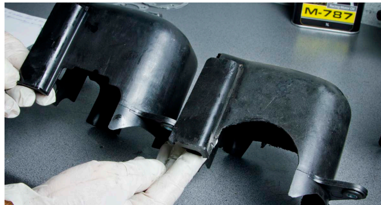
8. Découper, côté échappement, le cache plastique comme celui de droite.