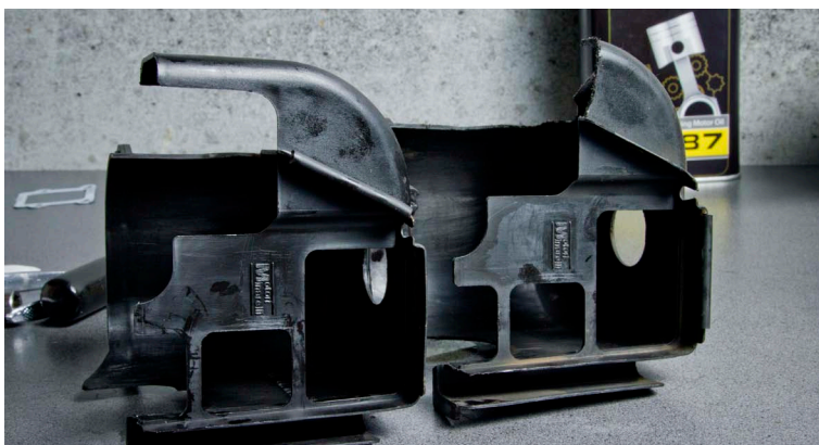
8-A. Idem côté admission si vous monter une boîte à clapet Big Valve.